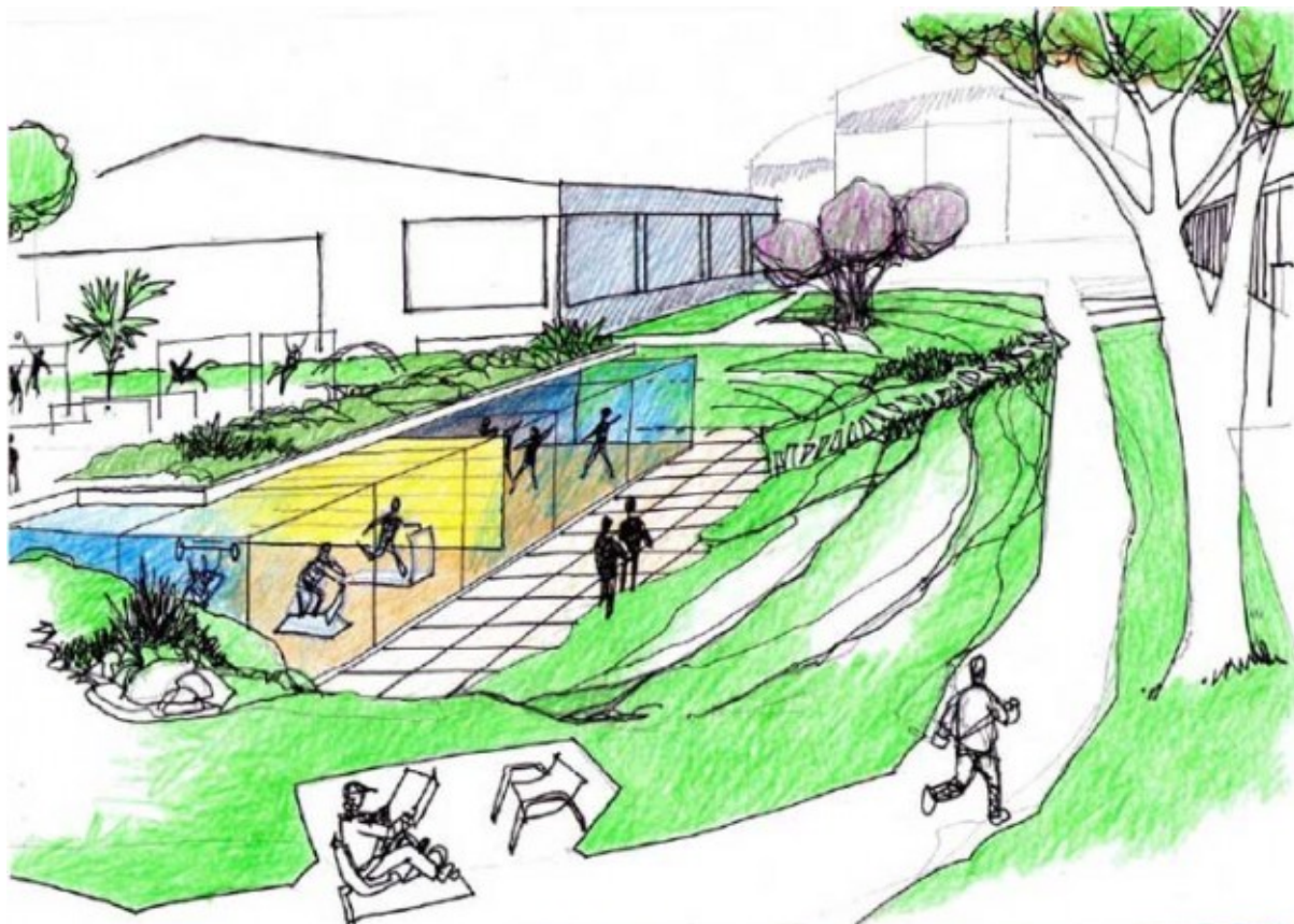
REGENERACIÓN DEL ÁREA DE PISCINAS EXTERIORES, POLIDEPORTIVO MUNICIPAL TORRELODONES.